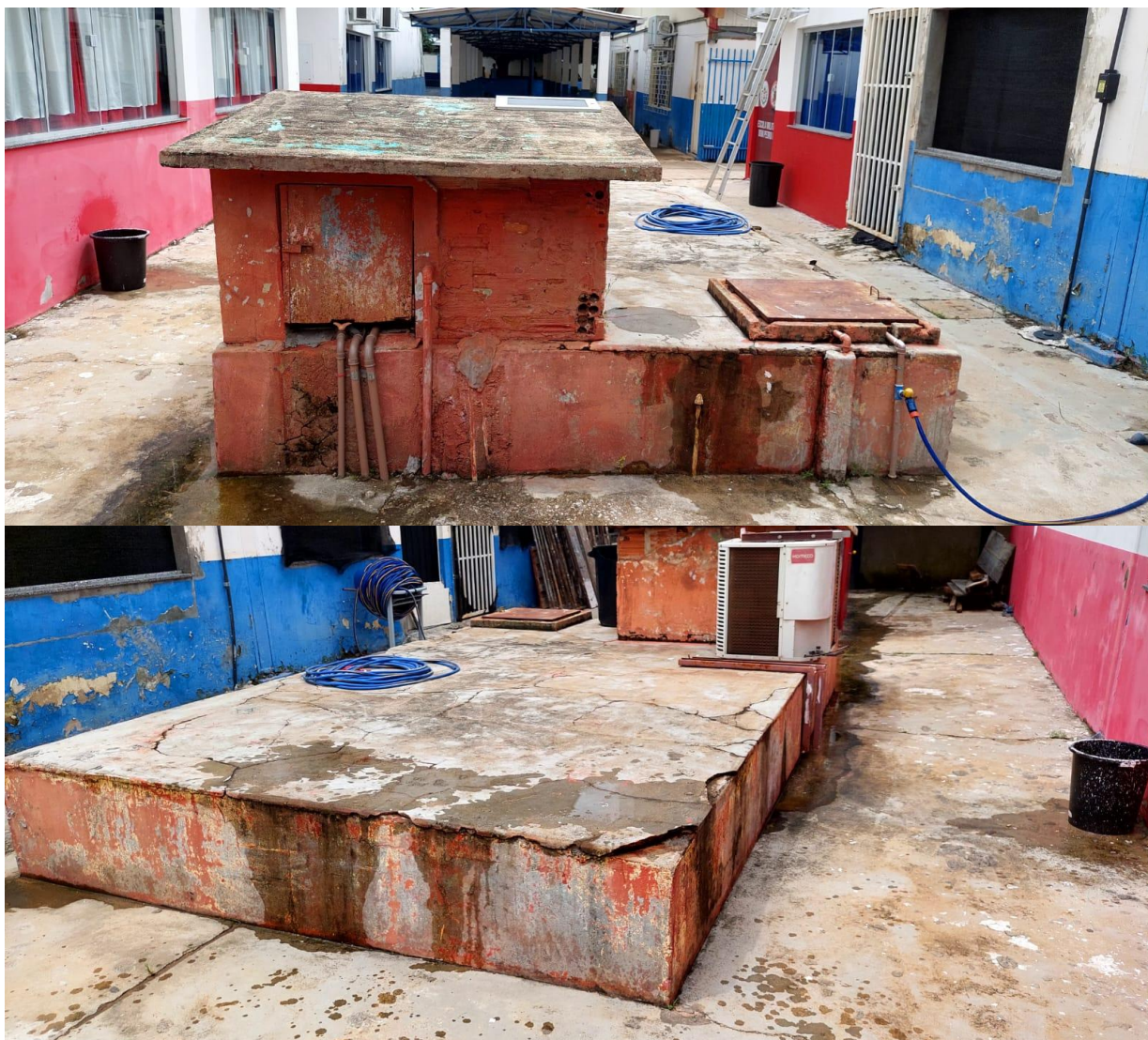
PINTURA LATERAIS E DA "CASA DE BOMBA" DA CISTERNA.

ITEM 2: PINTURA LÁTEX ACRÍLICA PREMIUM, APLICAÇÃO MANUAL EM PAREDES, DUAS DEMÃOS. AF_04/2023 (88489) Composição SINAPI: 88489